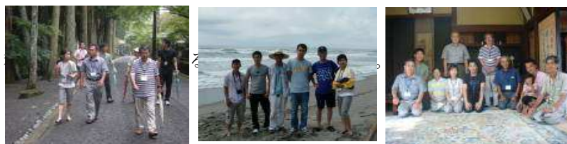
2009年のトライアル実施時のスナップです