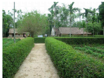
ゲアン ホーチミン生家記念館

(B) 古都フエに記念碑を贈るベトナム5日間の旅(11/2 発) フエでの記念行事に参加、ホイアン、ホーチミンの市観光も。 成田、名古屋、関西、福岡出発が可能です。