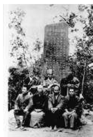
袋井市梅山常林寺 (1918)