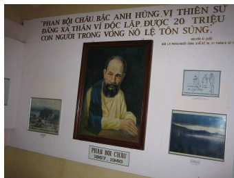
フエ ファンボーイチャウ記念館

申込み：富士ツリスト(株)：0120-898928 / 052-261-4621 名古屋空港発 他成田、関空発も可能