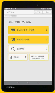
決済専用タブレット